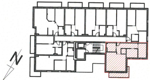
LOKALIZACJA MIESZKANIA NA RZUCIE SKALA 1:500