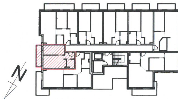
LOKALIZACJA MIESZKANIA NA RZUCIE SKALA 1:500